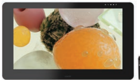
Prezentowany artysta: David McLeod

Wacom Cintiq Pro 32 i 24 to zaawansowane ekrany piórkowe dla kreatywnych. W połączeniu z piórem Wacom Pro Pen 2 umożliwiają proces tworzenia pozwalający na przekraczanie kolejnych granic w projektach graficznych.